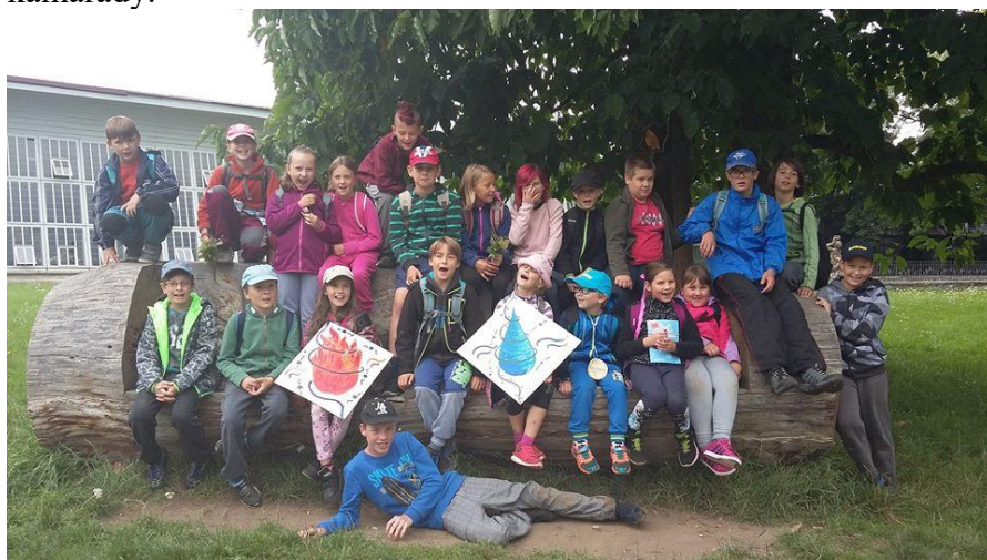
Obrázek 1 Děti ze 3. turnusu PT s ČÁPEM

Díky silnému, početnému a zkušenému týmu vedoucích a asistentů, kdy se o každý oddíl čítající 10 dětí staral 1 vedoucí a 1 asistent, se mohly tábora zúčastnit i děti se zdravotním či sociálním znevýhodněním. Tématem celotáborové hry, bez které se žádný pořádný tábor neobejde, byly České báje a pověsti (S Bivojem na kance, Dívčí válka atd.). Děti si vyzkoušeli keramickou dílnu, projely se na koních, podnikly výpravy do okolí a našli si nové kamarády.