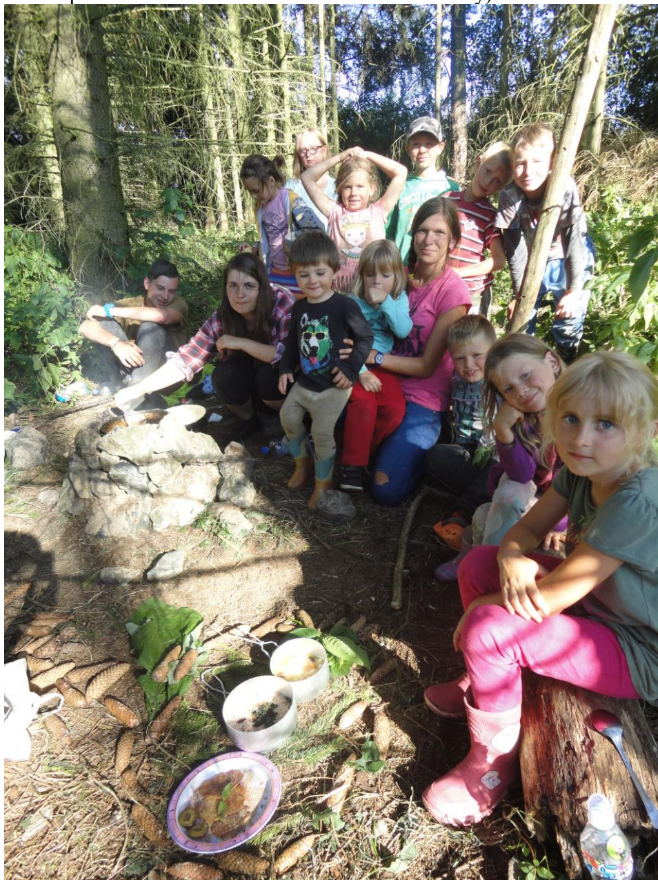
Obrázek 2: Den v lese - vaření oběda

Po úspěšném táboře v roce 2015 jsme navázali druhým ročníkem pobytového Indiánského tábora, navýšili jeho kapacitu na 30 míst a přesunuli do nového tábořiště u Hořehled. Tábor byl určen dětem od 5 do 12 let. Tábor jsme plánovali i realizovali ve spolupráci s oddílem Malých tuláků – MOP (sdružení Malých ochránců přírody). Tábořila se zúčastnilo 26 dětí (čtyři děti na poslední chvíli kvůli nemoci svou účast zrušily).