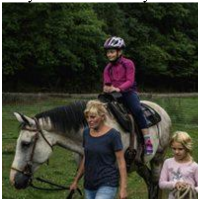
Obrázek 1 Děti ze 1. turnusu PT s ČÁPEM – projížďky na konících

Tématem celotáborové hry, bez které se žádný pořádný tábor neobejde, byly Dobříšské báje a pověsti. Děti si vyzkoušeli tvořivou dílnu, projely se na koních, podnikly výpravy do okolí a našly si nové kamarády.