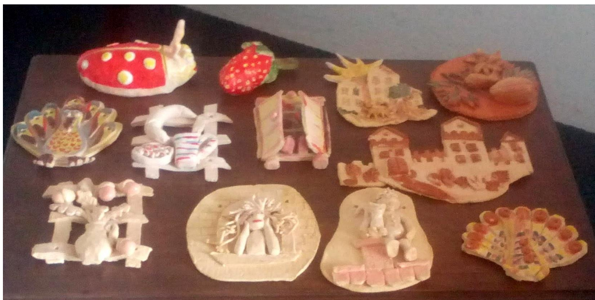
Obrázek 2: Výrobky z kroužku Keramika